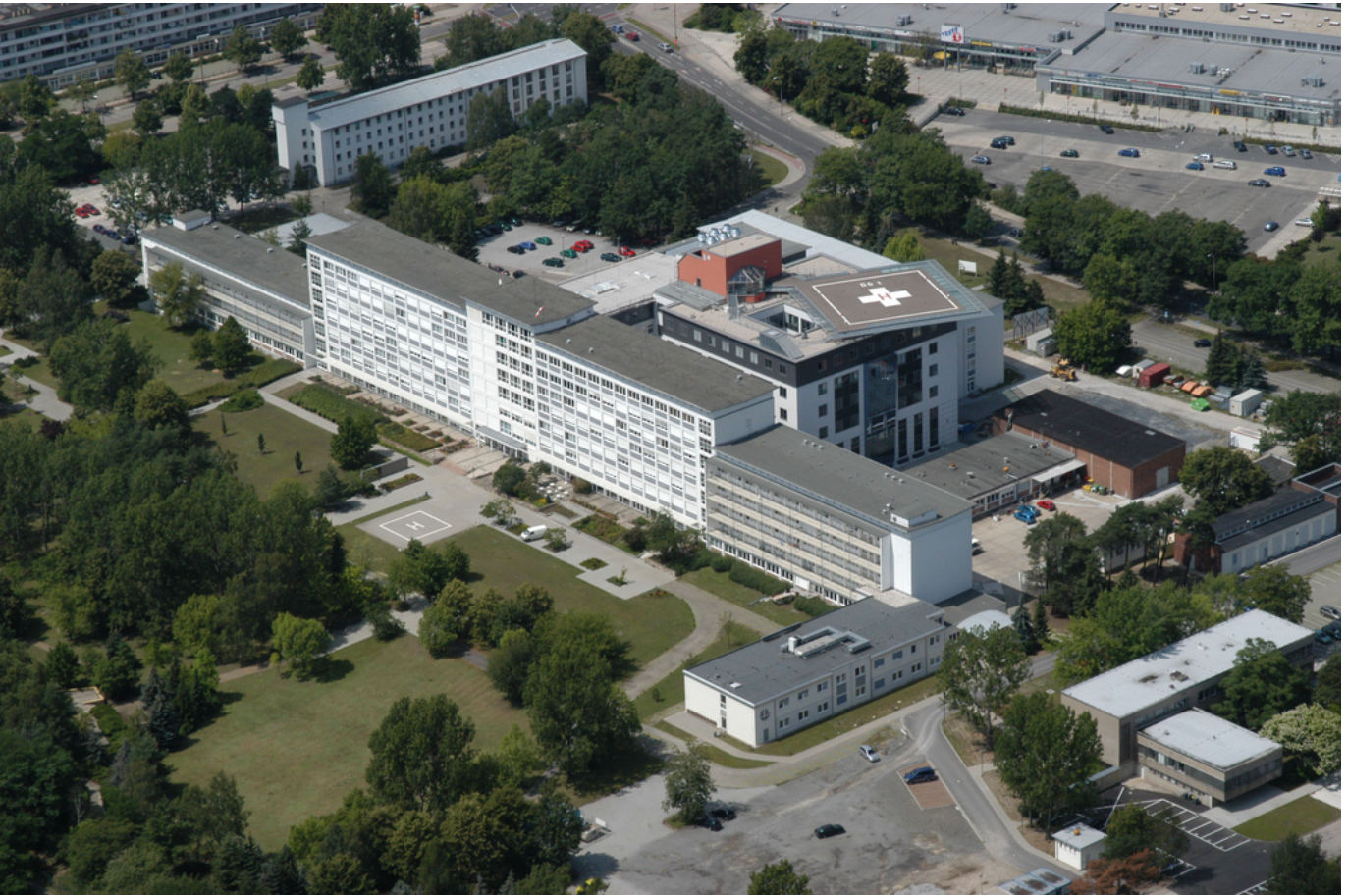
Abbildung: Klinikum Hoyerswerda: Auf dem Dachbereich des Untersuchungs- und Behandlungstraktes befindet sich der Hubschrauberlandeplatz mit direkter Anbindung an OP-Bereich und Notfallversorgung

Am Klinikum Hoyerswerda wird eine an medizinischen Leitlinien und ethischen Grundsätzen ausgerichtete Medizin zum Wohle des Patienten praktiziert, mit dem Ziel, Kranke zu heilen, Schmerzen zu lindern und die Lebensqualität der Patienten zu erhöhen. Damit verpflichten wir uns den Grundsätzen eines umfassenden Qualitätsmanagements.