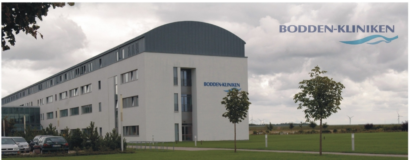
Abbildung: Krankenhaus Ribnitz-Damgarten, Blick auf das Bettenhaus