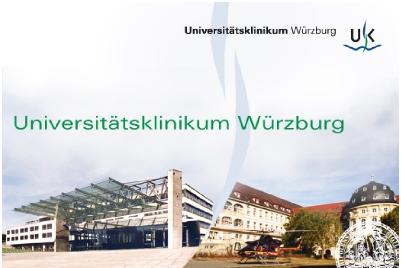
Abbildung: Universitätsklinikum Würzburg (Neubau ZOM / Altbau)

Wir wollen Ihnen mit diesem Bericht zeigen, was wir machen, wie gut wir es machen und was wir Ihnen bieten können. Mit „Ihnen“ meinen wir nicht nur Patienten, sondern auch deren Angehörige, Besucher und einweisende Ärzte sowie auch all unsere Mitarbeiter. Die Darstellung unseres Klinikums bezieht sich daher nicht nur auf das rein medizinische Geschehen, sondern auch auf Räumlichkeiten, Ausstattungen und sonstige Serviceangebote. Wir möchten Sie darüber hinaus aber auch über unsere geplanten baulichen und strukturellen Entwicklungen informieren.